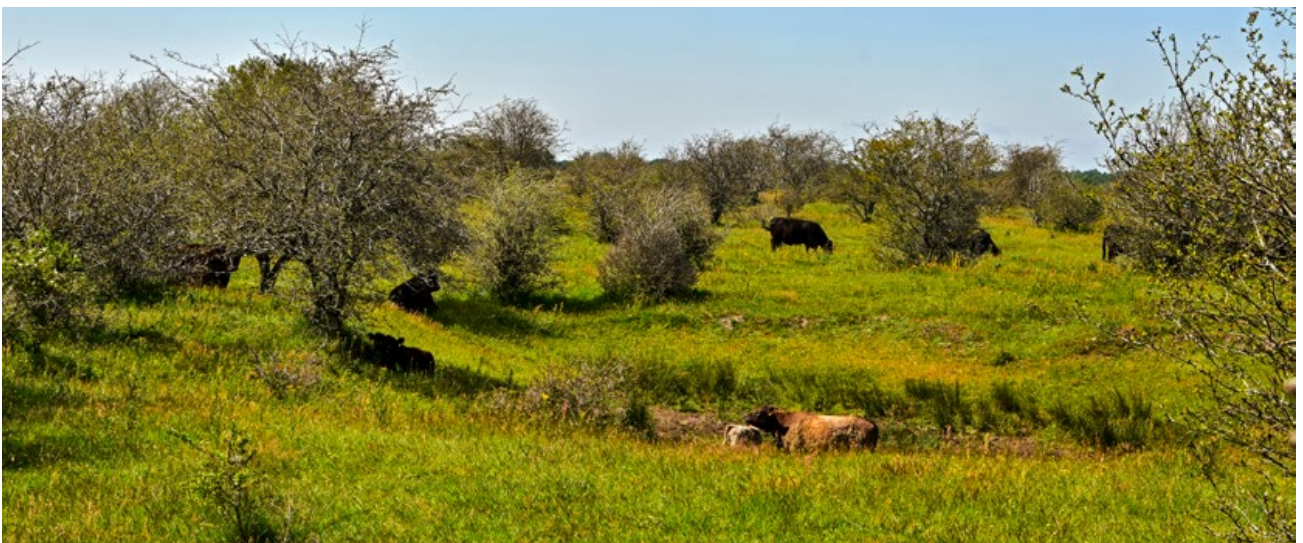
In reich strukturierten Weidelandschaften, wie den „Wilden Weiden Schäferhaus“ ist der Witterungsschutz ganzjährig gegeben.