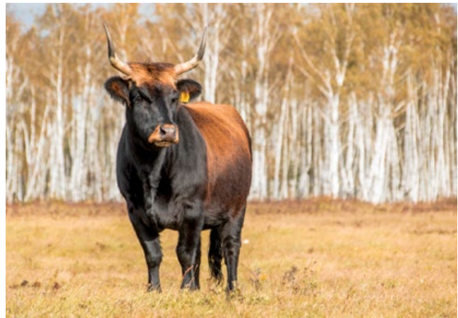
Heckrind in der Oranienbaumer Heide. Die munitionsbelastete Fläche wurde bis 1992 militärisch genutzt.

Bei der Einrichtung von Beweidungen auf munitionsbelasteten Flächen oder Munitionsverdachtsflächen sind die Ordnungsbehörden einzubeziehen und die flächenspezifischen Gefahrenabwehrverordnungen zu berücksichtigen. Zu unterscheiden sind hier Bereiche, auf denen auf Grund nachgewiesener Belastungen ein Betre-