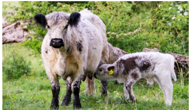
Galloway-Kuh mit Kalb in der Weidelandschaft Ferbitzer Busch (Foto: Max Jung).