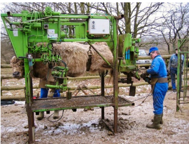
Ist die natürliche Abnutzung nicht ausreichend, ist eine fachgerechte Huf- und Klauenpflege durchzuführen.

sollte sie einige Wochen vor dem Frühjahrsaustrieb im Stall oder auf der Winterweide erfolgen.