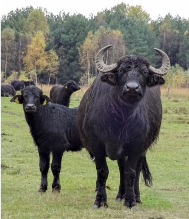
Wasserbüffel eignen sich gut für nasse Flächen oder wenn es um die Offenhaltung von Gewässern geht (Foto: Katharina Kuhlmei).

schnell verfetten und ernsthafte gesundheitliche Probleme bekommen können. Grundsätzlich können auch Kreuzungen verschiedener Rassen eingesetzt werden. Wasserbüffel eignen sich beispielsweise gut für nasse Flächen und wenn es um die Offenhaltung von Gewässern geht (KTBL E. V. 2010). Dabei haben sich die ursprünglich aus den rumänischen Karpaten stammenden Linien als besonders geeignet herausgestellt. Sie können in den meisten Regionen ganzjährig im Freiland gehalten werden.