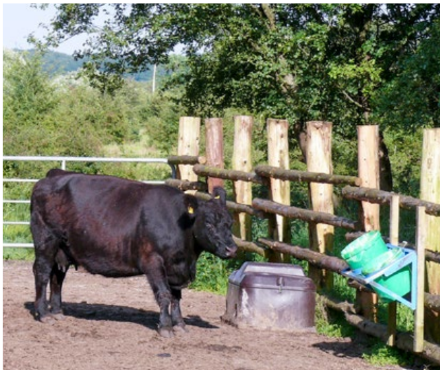
Frostsichere Tränke und Mineralleckeimer in der Fanganlage machen diese für die Weidetiere attraktiver.

Der Anhang III der Futtermittelhygieneverordnung schreibt vor, dass das Tränkwasser für die entsprechende Tierart "geeignet" sein muss und benennt die Parameter Schmackhaftigkeit, Verträglichkeit und Verwendbarkeit.