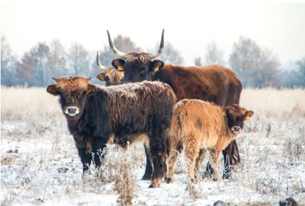
Bei der Ganzjahresbeweidung decken die Tiere ihren Futterbedarf i.d.R. aus dem natürlichen Aufwuchs. Hierfür muss am Ende der Vegetationsperiode genügend Aufwuchs vorhanden sein, damit sich die Tiere auch im Winter bedarfsgerecht ernähren können.