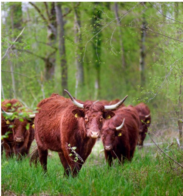
Salser-Rinder im Auwald „Wilde Weiden Taubergießen“ (Foto: Thomas Kaiser).

pächtern, da ganzjährig auf den Flächen stehende Weidetiere die Bejagungsmöglichkeiten der Flächen einschränken. Drückjagden, so sie denn aufgrund der starken Beunruhigung auf den Weideflächen überhaupt möglich sind, müssen genau geplant werden und detaillierte Absprachen erfolgen.